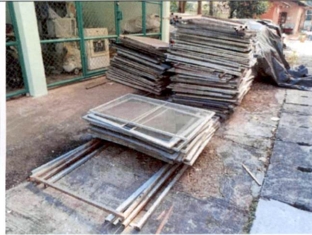
หน้าต่างมุ้งลวด(บานเลื่อน)

เป็นวัสดุที่ได้จากการดำเนินงาน โครงการปรับปรุงซ่อมแซมอาคารที่ทำการด้านศุลกากร อาคารด่านพรมแดนท่าสายลวด อาคารที่พักอาศัย และสิ่งปลูกสร้างประกอบ จำนวน ๓๓ รายการ