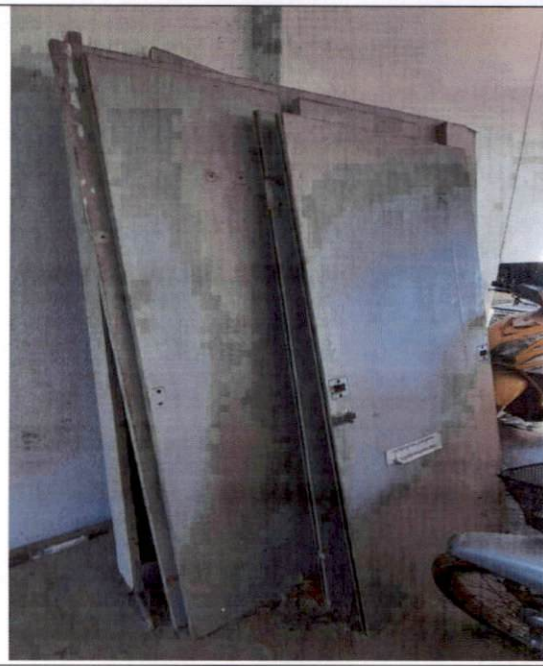
ฝาผนังกันห้องน้ำ