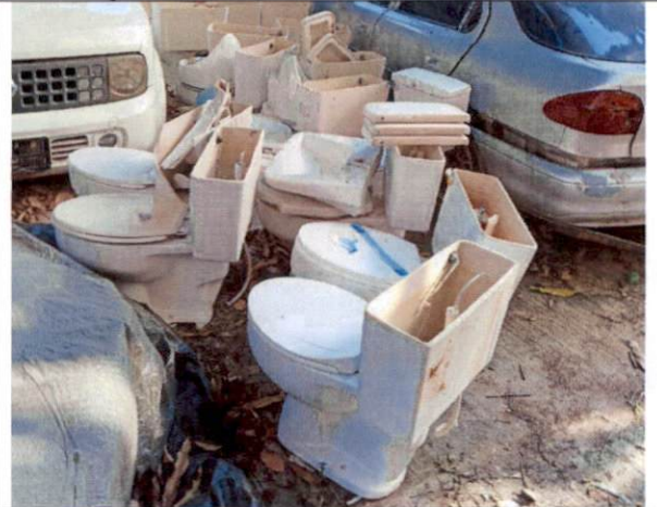
สุขภัณฑ์