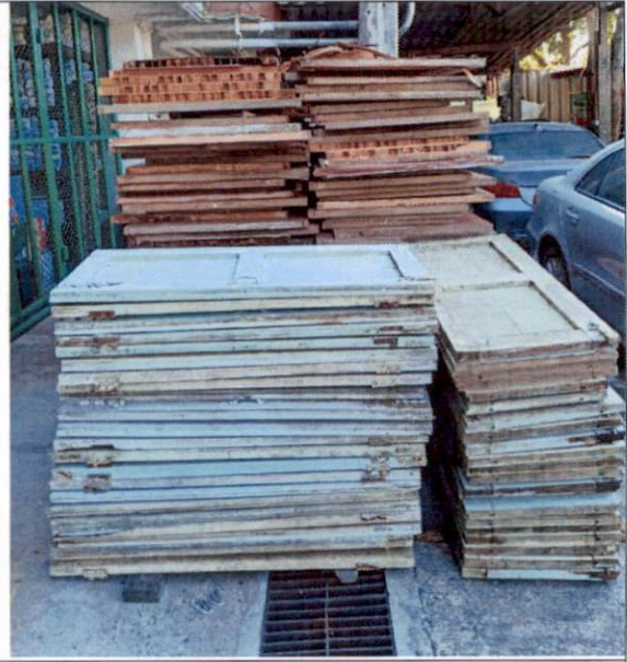
หน้าต่าง ไม้ และประตูไม้อัด