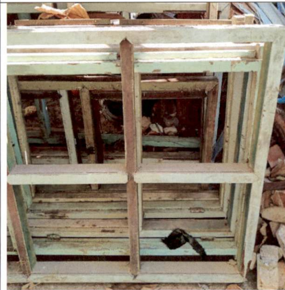
วงกบหน้าต่าง