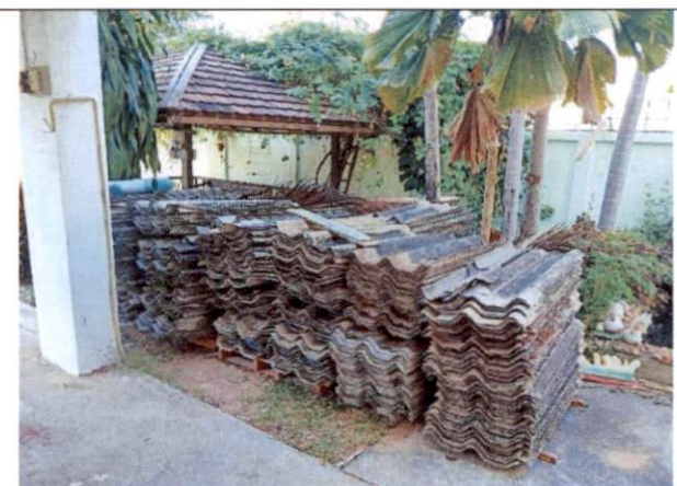
กระเบื้องหลังคา