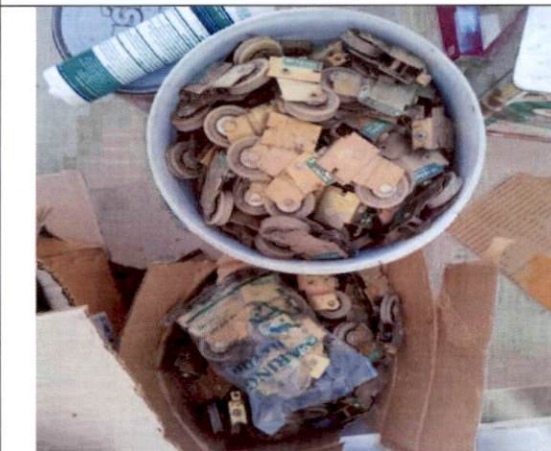
ล๊อบานหน้าต่าง