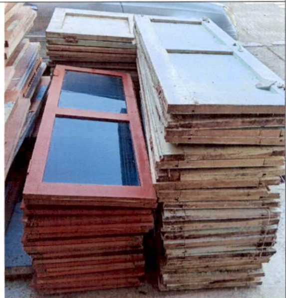
หน้าต่าง