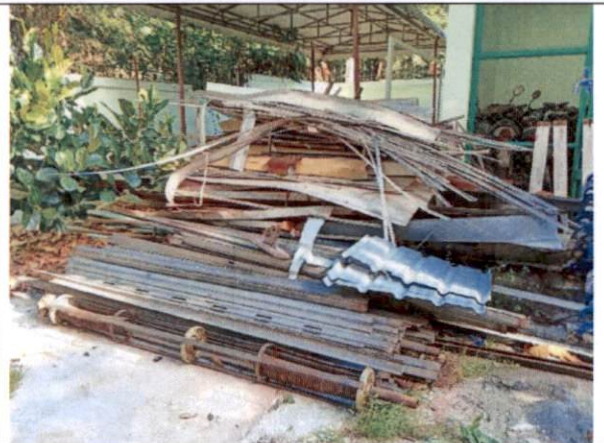
ประตूम้วนเหล็ก รางรินน้ำฝน