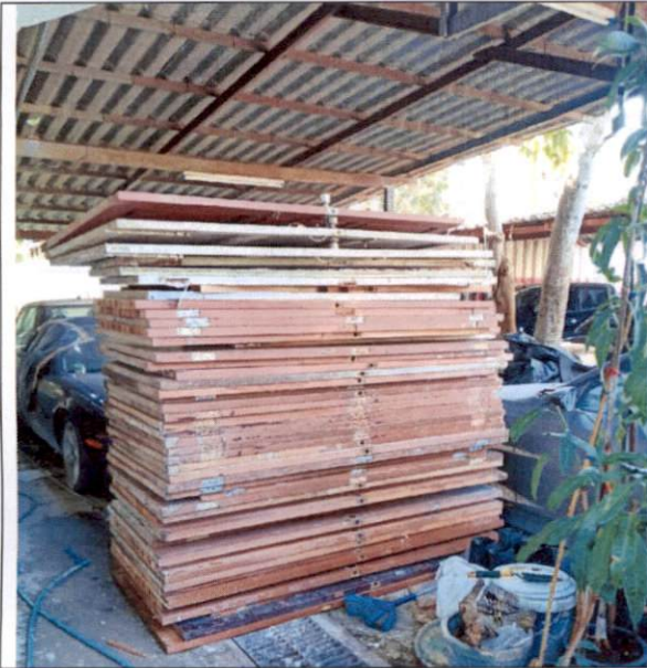
ประตูไม้ และประตูไม้อัด