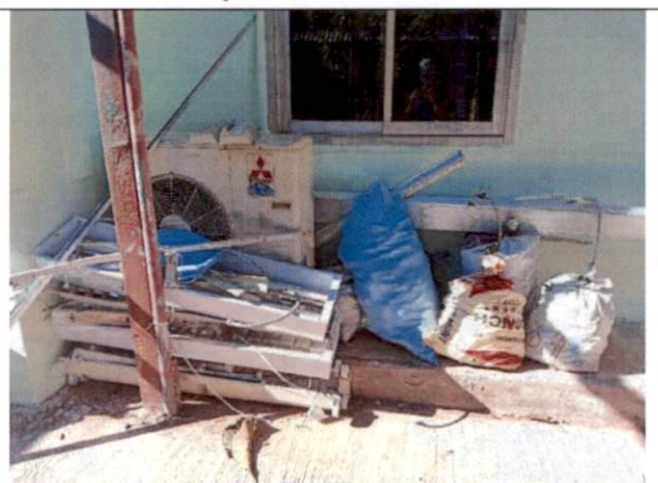
ลูกบิด บานพับประตู