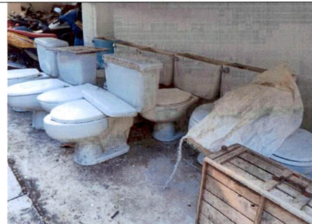
สุขภัณฑ์